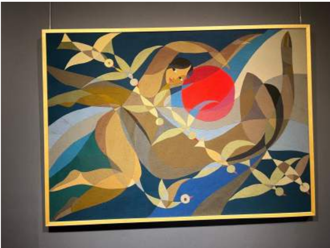
Рис. 10 Робота Любові Панченко, представлена на ретроспективній виставці «Всесвіт Любові» в Музеї історії міста Києва (2025). Фото зроблено під час відвідин експозиції.

Для роботи над обкладинкою було обрано фотографію роботи Любові Панченко, зроблену під час її ретроспективної виставки «Всесвіт Любові», що проходила з 13 лютого до 1 червня 2025 року в Музеї історії міста Києва (МВЦ, вул. Богдана Хмельницького, 7). Ця експозиція зібрала понад 500 творів художниці-шістдесятниці — живопис, графіку, ескізи костюмів і вишивки, демонструючи всю глибину її творчого всесвіту символізм події та художню цінність творів, макет обкладинки журналу базується на цьому зображенні — для того, щоб підкреслити тему випуску, та відобразити художній стиль Панченко в контексті науково-мистецького дослідження [13].