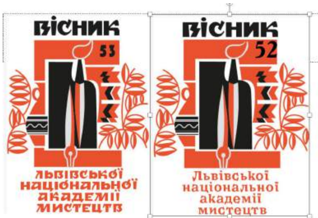
Рис. 4 Обкладинка «Вісник Львівської національної академії мистецтв»/

форми (прямокутники, коло) та орнаментальні мотиви – вона виконує роль логотипа журналу. Поряд великими літерами написано слово «Вісник» і номер випуску; унизу – назва академії. Композиція побудована за принципом центрування: емблема в центрі, навколо неї симетрично розташовано текстові блоки. Чорно-червона кольорова гама на білому тлі створює виразний контраст і відсилає до традицій українського графічного дизайну та книжкової графіки. Типографіка обкладинки вирізняється використанням авторського шрифту з художніми елементами – назва виконана у стилізованому шрифтовому рисунку, що підсилює художній характер видання. Таким чином, «Вісник ЛНАМ» вибудовує власний візуальний образ через символіку (емблему) та оригінальний шрифт, асоціюючи видання з академічним мистецтвом Львова [9, 10].