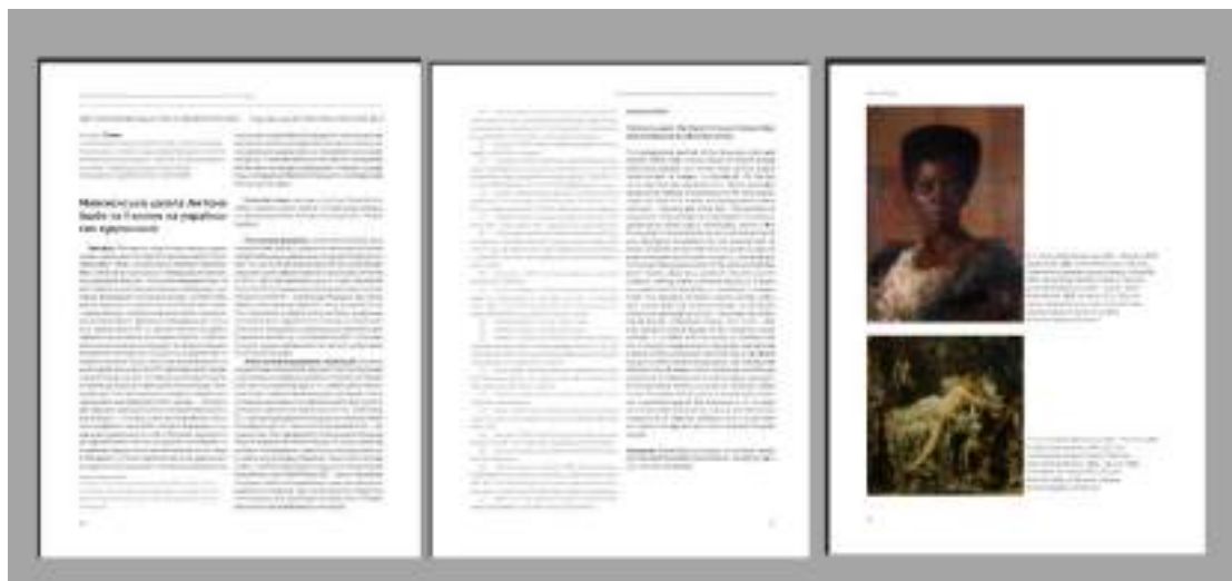
Рис. 15. Прототип верстки, проектованого видання. Шпальта у журналі «Вісник ЛНАМ».

У програмі Adobe InDesign створення нового документа починається з відкриття меню File → New → Document, де встановлюється формат сторінки А4 (210×297 мм) з вертикальною орієнтацією. Для забезпечення зручності читання задаються такі параметри полів: верхнє — 15 мм, нижнє — 15 мм, ліве — 20 мм, праве — 15 мм. Поле обрізу (Bleed): 3 мм з усіх боків. Для структурування тексту використовується двоколонкова верстка з відступом між колонками 5 мм, що відповідає стандартам оформлення наукових і публіцистичних матеріалів. Загальна кількість сторінок визначається як п'ять, із увімкненою функцією Facing Pages, яка дозволяє створювати розвороти — двосто