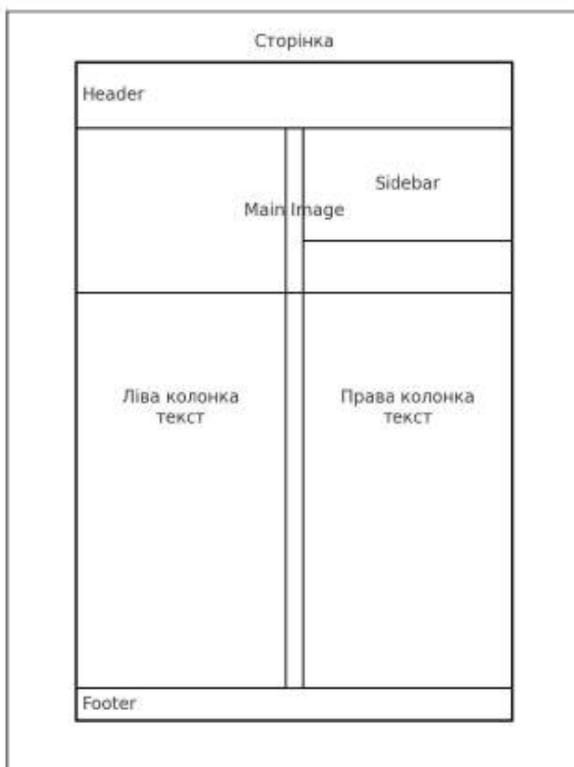
Рисунок 16. Приклад використання master-сторінки з колонками та нумерацією.

верхньому колонтитулі (Header) ліворуч розміщують назву рубрики (наприклад, У вимірі лімінальності: Буча і незавершена історія Любові Панченко), а праворуч — номер сторінки. У нижньому колонтитулі (Footer) можуть зазначатися дата публікації та логотип видавництва або назва журналу. У полі підполя (slug) доцільно додавати службову інформацію, зокрема позначку «Спеціальний випуск» або QR-код. Така структура забезпечує цілісність візуальної ідентичності видання та полегшує процес верстки, особливо коли кількість сторінок є значною.