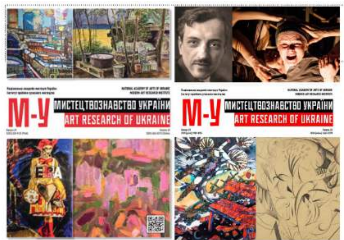
Рис. 3 Обкладинка збірника «Мистецтвознавство України».

зображення вписано у модуль сітки, утворюючи гармонійну мозаїку. Внизу подано номер випуску, рік та місто видання дрібнішим кеглем. Така композиція поєднує наукову інформативність (біле тло, чітка типографіка) з привабливістю художнього колажу, що відображає багатство українського мистецтва. Обрана візуальна стилістика підкреслює зв'язок традиції й сучасності: використання класичного білого фону і строгого шрифту в поєднанні з актуальним колажним дизайном обкладинки [7, 8].