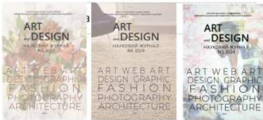
Рис. 1 Обкладинки наукового журналу «Art and Design».

номер випуску. Для логотипа «Art and Design» використано сучасний рубаний шрифт без засічок; сама назва подається англійською мовою, що підкреслює міжнародний характер журналу. Угорі обкладинки традиційно розміщено вихідні дані (установа-засновник, ISSN, номер і рік випуску), виконані дрібнішим шрифтом. Загалом композиція обкладинки цього журналу балансує між текстом і зображенням: фотографічний фон додає візуальної привабливості, а типографіка чітко ієрархізує інформацію [1, 2, 3].