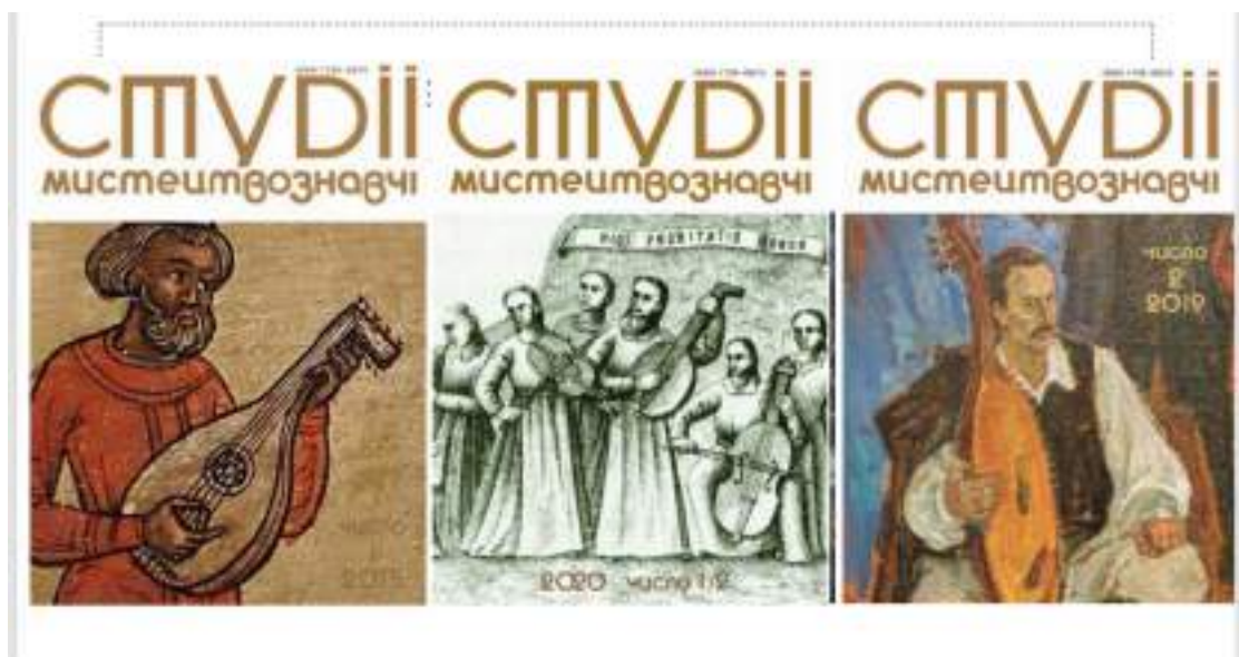
Рис. 2 Обкладинки журналу «Студії мистецтвознавчі».

кеглем у приглушених відтінках, що не конкурують із репродукцією, а доповнюють її. Всі обкладинки містять ISSN у верхньому правому куті, що відповідає стандартам наукового публікування. Загалом композиція є візуально вивіреною, статичною й симетричною, з орієнтацією на академічну стриманість і шанобливе ставлення до мистецького контенту. Такий дизайн сприяє формуванню іміджу видання як фахового наукового ресурсу з глибоким історико-культурним підґрунтям, де візуальність виконує не декоративну, а репрезентативну та змістову функцію [4, 5, 6].