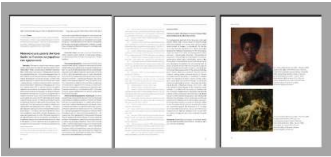
Рис. 6. Приклад двохколонної шпальти у журналі «Вісник ЛНАМ».

Двоколонна сітка спостерігається також у «Худпром» (новий журнал, очевидно, перейняв верстку від попереднього «Вісника ХДАДМ», де традиційно практикували 2 колонки). В той же час журнал «Art and Design» дотримується також двоколокового форматування тексту: згідно з вимогами для авторів, стаття готується на сторінці А4 12-кеглем з 1,5 інтервалом (рис. 7). У готовому номері «Art and Design» текст статті спочатку розміщується суцільною колонкою, що характерно для гуманітарних збірників з невеликою кількістю ілюстрацій [1; с. 51,55, 58].