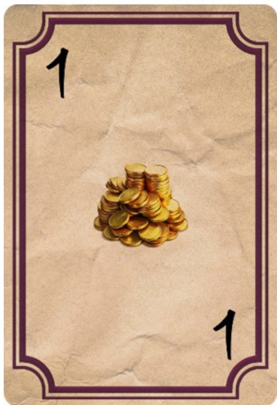
Рисунок 26 – Додаток Карточка 1