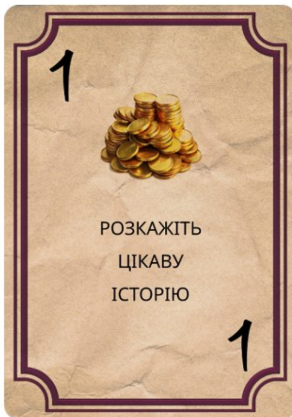
Рисунок 27 – Додаток Карточка завдання