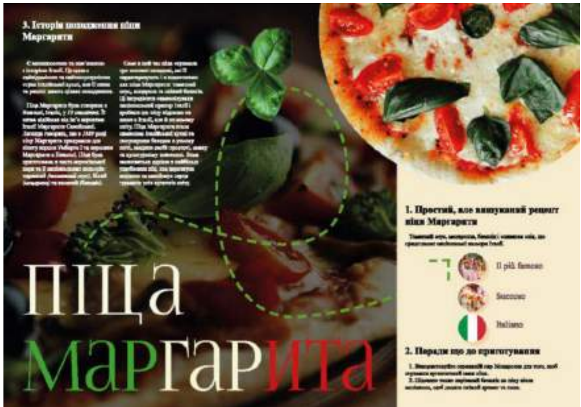
Рис. А.3. Розвороти журналу «СМАК ІТАЛІЇ»