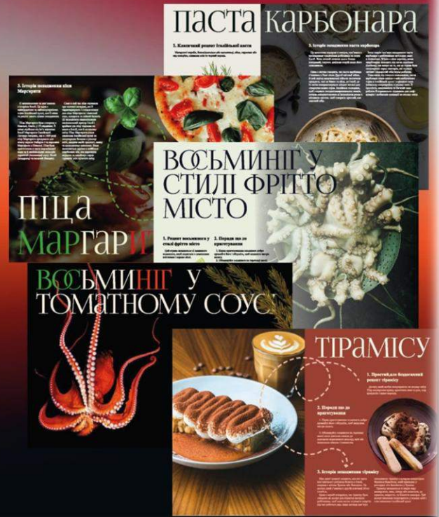
Рис. А.7. Демонстраційний лист для журналу «СМАК ІТАЛІЇ»