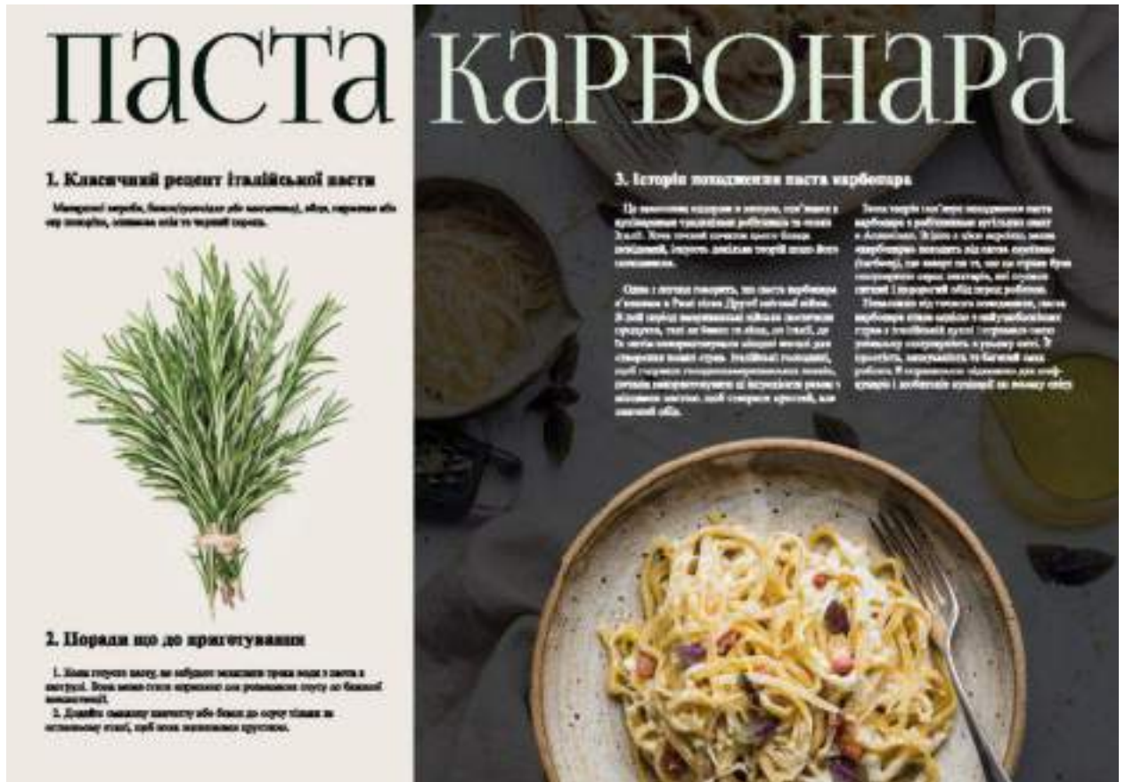
Рис. А.2.Розвороти журналу «СМАК ІТАЛІЇ»