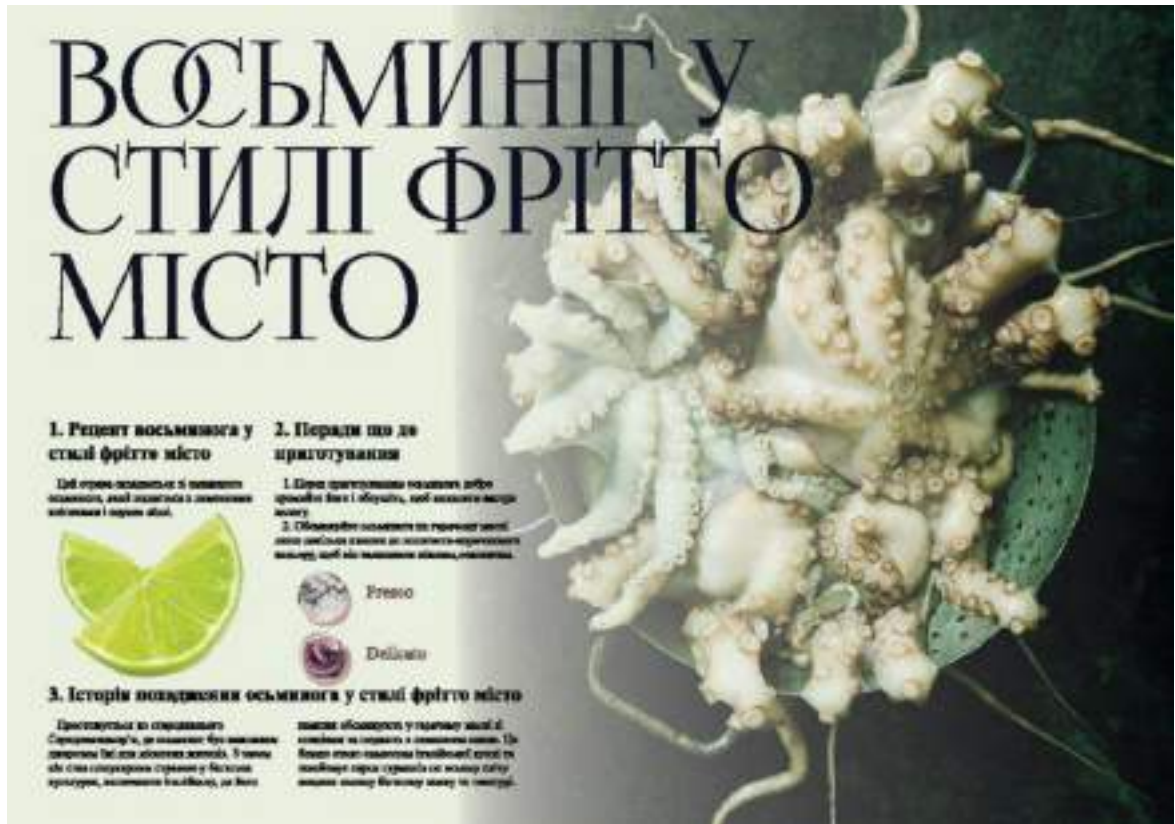
Рис. А.4. Розвороти журналу «СМАК ІТАЛІЇ»