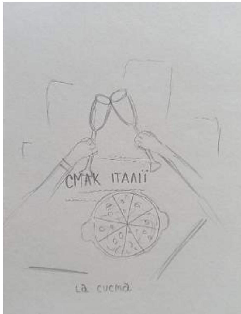
Рис. 3.4. Ескіз обкладинки для поліграфічного видання/журналу «СМАК ІТАЛІЇ»