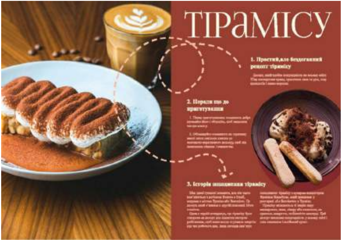
Рис. А.6. Розвороти журналу «СМАК ІТАЛІЇ»