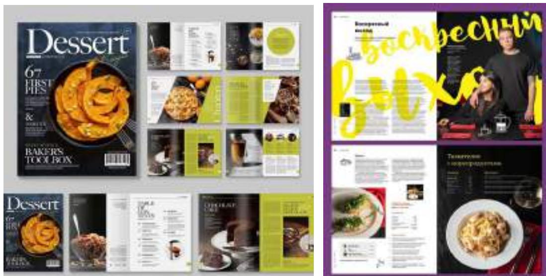
Рис. 3.1. Аналоги для поліграфічного видання/журналу «СМАК ІТАЛІЇ»

підготовчу роботу. А саме спочатку я знайшла велику кількість інформації про найпопулярніші італійські страви. Прислухалася до уваги як традиційним, так і сучасним рецептам [9]. Потім я проаналізувала всю інформацію яку знайшла, щоб виявити основні тренди та унікальні особливості італійської кухні. Після чого я переглянула та проаналізувала аналоги поліграфічних видань із схожою тематикою, ознайомлюючись з їхньою структурою, дизайном, структурою та маркетинговою стратегією. Це дало мені змогу краще зрозуміти ринок, визначити сильні і слабкі сторони конкурентів, а також сформулювати бачення того, як зробити свій журнал "СМАК ІТАЛІЇ" унікальним та привабливим для глядачів [10].