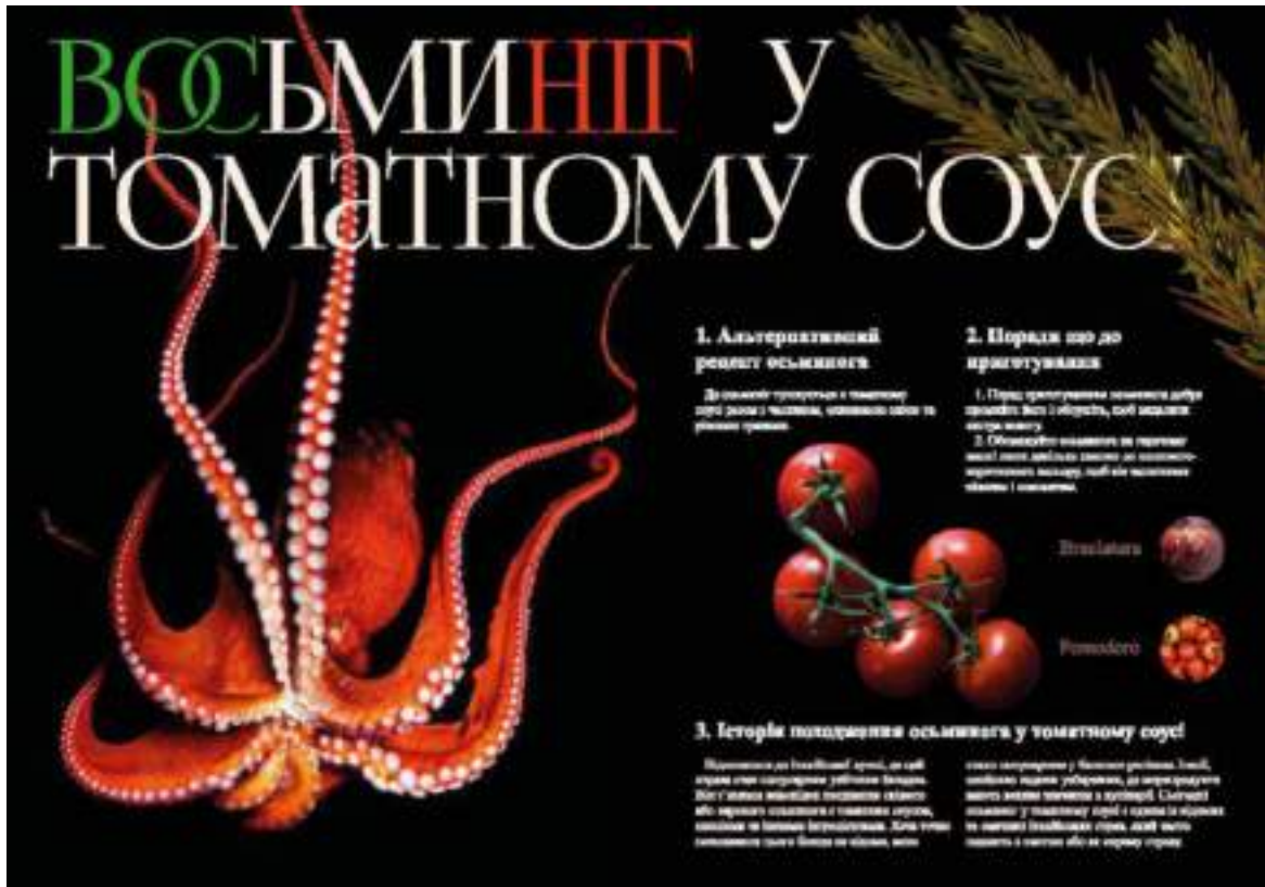
Рис. А.5. Розвороти журналу «СМАК ІТАЛІЇ»