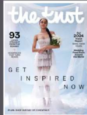
The Knot Spring 2024