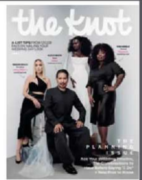
The Knot Fall 2023