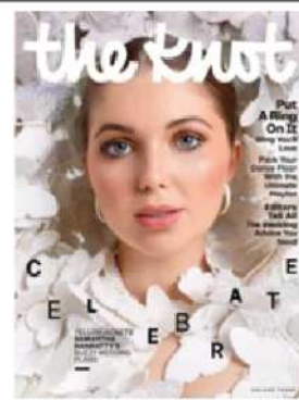
The Knot Winter 2023